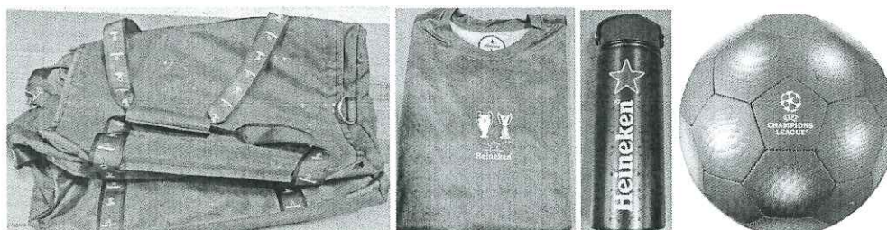
Kit de supporter (geantă, tricou, sticlă de apă, minge)