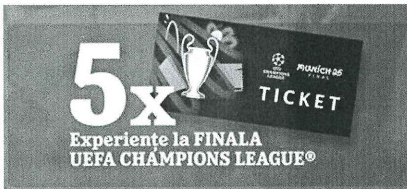
Bilete VIP la FINALA UCL – München 2025